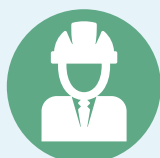
Proyectos de Inversión