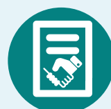
Acuerdos del Concejo