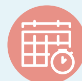
Agenda del Alcalde