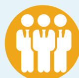
Directorio de funcionarios